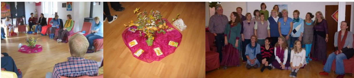
Eindrücke von Seminaren

Die Meister/innen und Weltenlehrer der 12 Göttlichen Strahlen weiten und heben das Bewusstsein der Teilnehmer durch ihre Energien. Die persönlichen und aktuellen Fragen werden nach den einzelnen Runden ausführlich aus der geistigen Welt beantwortet.